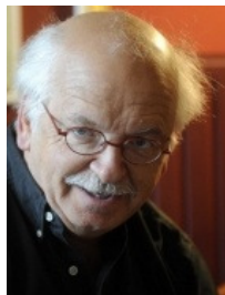
Erik Orsenna